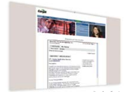
site du client

LES CANDIDATS SONT REDIRIGÉS sur votre site. Vous utilisez votre système de recrutement et augmentez le flux de candidatures.