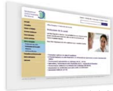
site du client