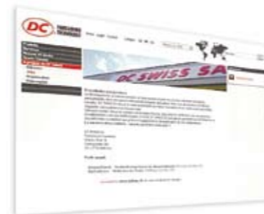
site du client